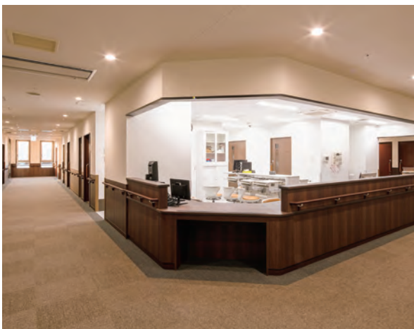
スタッフステーション